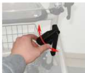
B. Riegel justieren