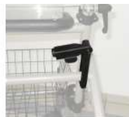
C. Riegel offen