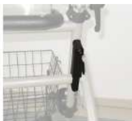
A. Riegel gesichert